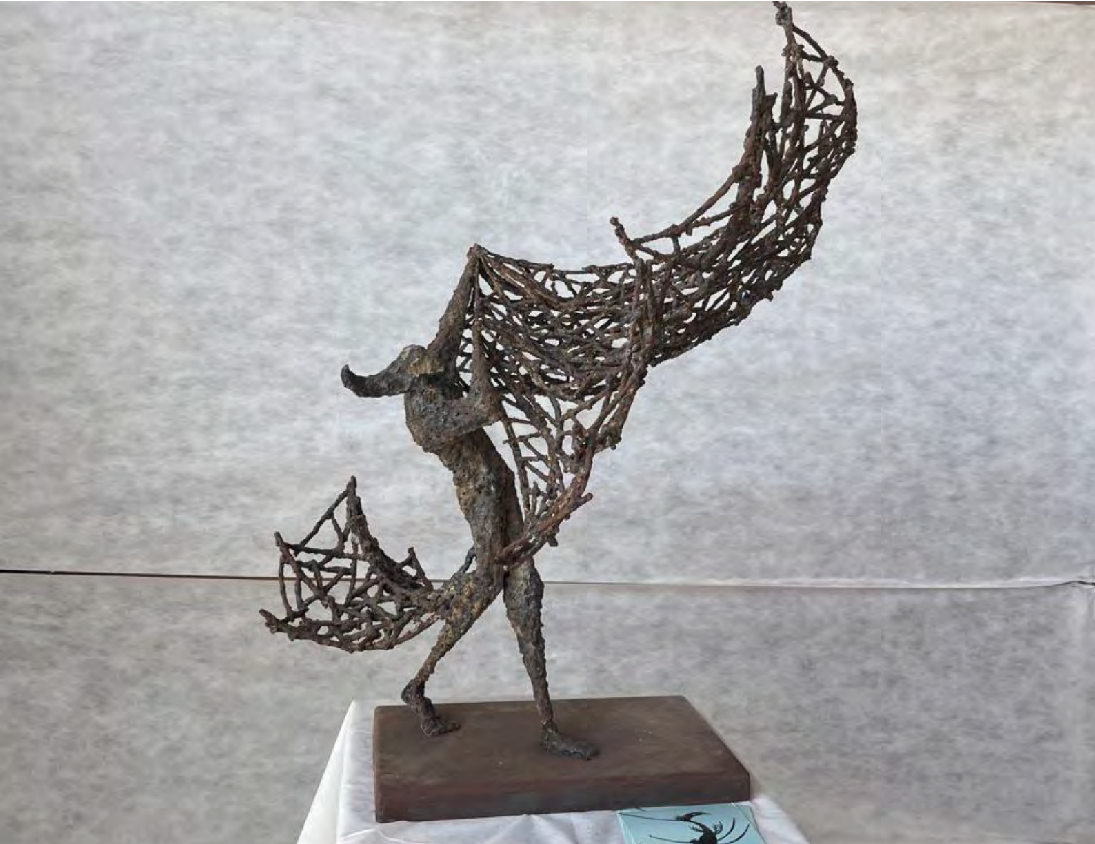
إيهاب فراج EHAB FARRAG