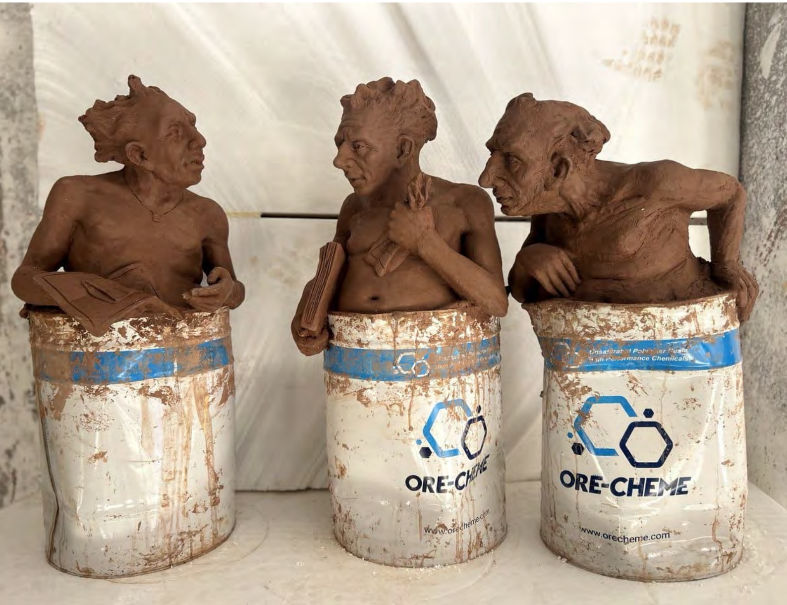
إبراهيم عوض IBRAHIM AWAD