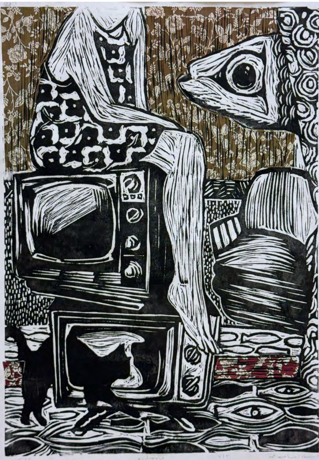
أسماء أسامة ASMAA OSAMA