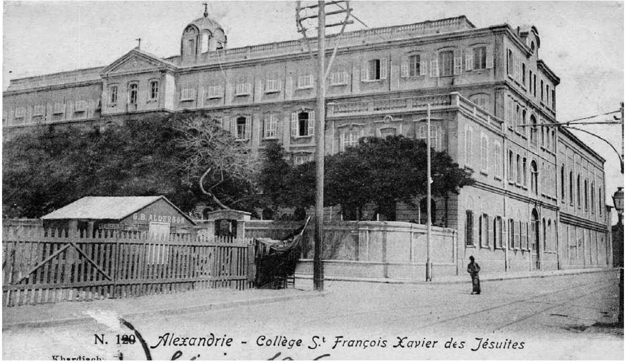
مدرسة الجزويت بشارع إسماعيل مهنا بقسم العطارين (مديرية الأمن حالياً)