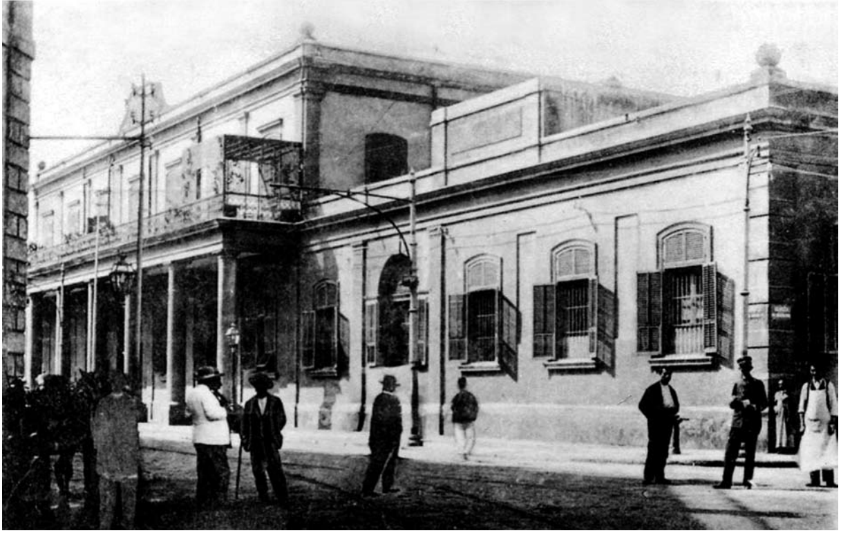
بورصة ميناء البصل عام ١٩٠٠م

لإفريقية، والرابع في تاريخ الدولة العبيدية (أي الفاطمية، نسبة إلى عبيد الله المهدي مؤسسها)، والخامس في تاريخ أهل صنهاجة (وهي إحدى القبيلتين الكبيرتين في الأقطار المغربية، والثانية هي قبيلة زناتة، والصنهاجيون معظمهم جزائريون)، والسادس في تاريخ بني حفص أمراء الدولة الحفصية التي حكمت البلاد التونسية وأجزاء أخرى من المغرب العربي، والسابع والثامن في تاريخ الحكم التركي، أما خاتمة الكتاب فيتحدث فيها ابن أبي دينار عن الأحداث المتأخرة في البلاد التونسية، وقد طبع الكتاب في تونس عام ١٢٨٦هـ (١٨٦٩م) ونقله إلى الفرنسية (بيلسييه وريموزا Pellissier