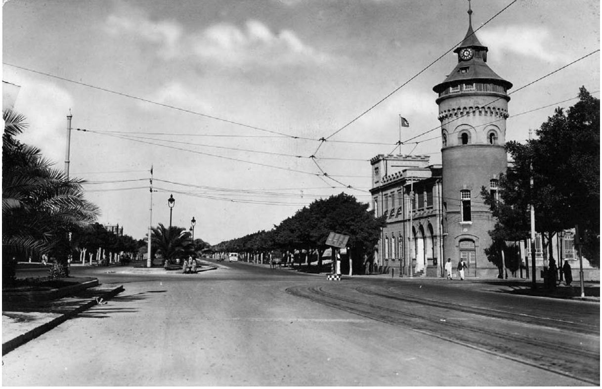
قسم باب شرقي

ودجيل اسم شارع بغداد كان ابن الجهم يقيم فيه ، وقد مات بسبب هذه الطعنة عام ٢٤٩ هـ (٨٦٣م) ، ومن شعره الذي نظمه عندما ذاق مرارة الفراق ولوعة الاغتراب هذه الأبيات الرقيقة: وَدَجِيلُ اسْمِ شَارِعِ بَغْدَادَ كَانَ ابْنُ الْجَهْمِ يَقِيمُ فِيهِ ، وَقَدْ مَاتَ بِسَبَبِ هَذِهِ الطَّعْنَةِ عَامَ ٢٤٩ هـ (٨٦٣ م) ، وَمِنْ شِعْرِهِ الَّذِي نَظَّمَهُ عِنْدَمَا ذَاقَ مَرَارَةَ الْفِرَاقِ وَلَوْعَةَ الْاِغْتِرَابِ هَذِهِ الْاَبْيَاتِ الرَّيْقِيَّةَ: