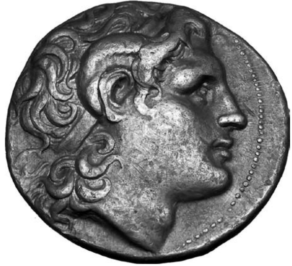
عملة فضية للإسكندر الأكبر

بيد أن هذا الزحف لم يتم إذ حدث اغتيال فيليب الثاني بيد قاتل يقول بعض المؤرخين أنه أحد أعوان «أولمبياس Olympias» الذي زوجته أم الإسكندر، وهي أميرة